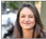
Irina Karamanos Coordinadora sociocultural de la Presidencia

Ingeniera química y magíster en Ciencias de la Ingeniería, con más de 25 años de experiencia en gerencia y dirección, tanto en el sector público como privado, y en ámbitos como innovación, transferencia tecnológica y procesos de inteligencia de mercado. Es mentora de Mujeres Empresarias, ComunidadMujer y Start-Up Chile. Además, es parte del consejo estratégico de la Incubadora Chrysalis (PUCV) y del Consejo Empresarial del Consorcio 2030 de universidades. Hoy es presidenta de CorreosChile y de Enap, compañías públicas que suman 8.500 colaboradores.