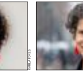
Maisa Rojas Ministra del Medio Ambiente

Lidera la Agencia de Promoción de la Inversión Extranjera, con especial foco en la exportación de servicios basados en conocimiento. "Nuestro futuro está en el talento de nuestra gente y fomentarlos es un aporte a la democratización de los beneficios del crecimiento. Esto es algo en lo que creo profundamente. He tenido la oportunidad de impulsar los programas de habilidades digitales y la primera visa para atracción de talento sofisticado de InvestChile", indica. Dice que su mayor desafío hoy es que la inversión extranjera sea una herramienta que contribuya a la sofisticación económica y al desarrollo de las regiones.