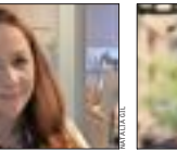
Natalia Piergentili Domenech Presidenta del PPD

Debido a enfrentar desde este recinto público la crisis de la pandemia y cómo esta redefinió el trabajo con los pacientes críticos. En ese escenario, coordinó el crecimiento y complejización de las camas críticas de la unidad con el objetivo de salvar vidas y cuidar la salud de sus funcionarios. "Creo que hicimos un buen trabajo y agradezco a mis colegas, a los enfermeros, kinesiólogos, técnicos paramédicos, auxiliares de servicio y aseo que duplicaron sus esfuerzos para responder a mis lineamientos. Vi cómo cada funcionario entregó su mejor esfuerzo día a día", expresa.